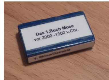
Abbildung 1 Auf dieser Seite wird angezeigt zu welchem Zeitpunkt die berichteten Ereignisse stattfanden.